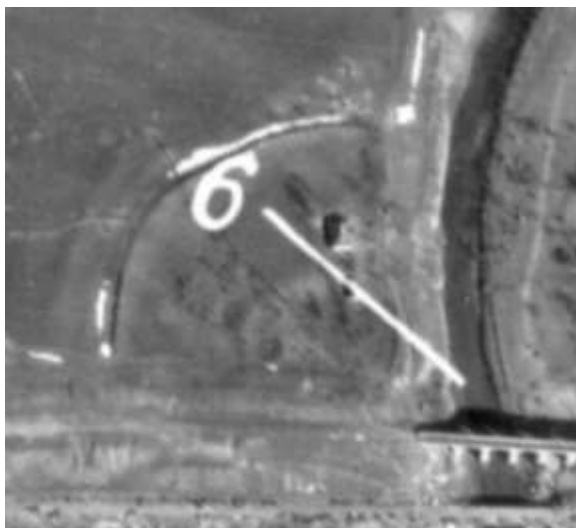
Рис. 5. Фрагмент городища Плав на німецькому аерофотоплані 1944 р.