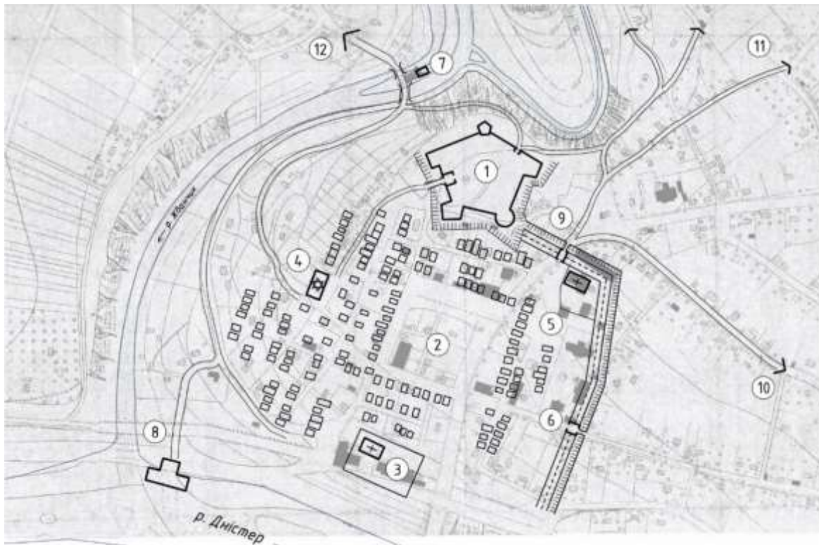
Рис. 8. Гіпотетична реконструкція укріплень Жванця у XVII-XVIII ст. :

взаємопов'язані і однозначно є одночасовими. Вони склалися з сухого рову, валу, можливо, з частоколом та двох брам. Обрис оборонного периметру був майже квадратним в плані, північний відрізок його був прямий, а східний мав невеликий залом у бік поля, спричинений, можливо, особливостями рельєфу (примикаючи до цього відрізка балки ззовні від міста). Зі сторони каньйону та замку місто додатково не захищалося. Відомості про вежі, башти чи бастионні міські укріплення відсутні. По центру міста розташовувалась ринкова площа. За конфігурацією вона була правильної прямокутної форми, наближеної за пропорціями своїх сторін до квадрату, до якого з південної сторони примикали торгові заїжджі квартали. По периметру ринку розміщувались кам'яниці й торгові лавки. Загальні розміри ринкової площі склали 1,765 га. Його територія у XIX ст. забудована торговими ятками, а пізніше з'явився повноцінний квартал, який існує по сьогодні. В результаті цього від незабудованої території давньої площі залишився невеликий фрагмент її північної частини. Недалеко від ринкової площі розташовувався костел, який був оточений кам'яними мурованими стінами і ймовірно виконував оборонно-караульну функцію. З 1740 р. на його місці збудовано мурований костел Непорочного Зачаття Діви Марії, який закінчений та освячений у 1791 році із втратою своїх оборонних функцій.