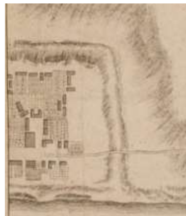
Рис. 2. План Манитайна станом на 1739 р.