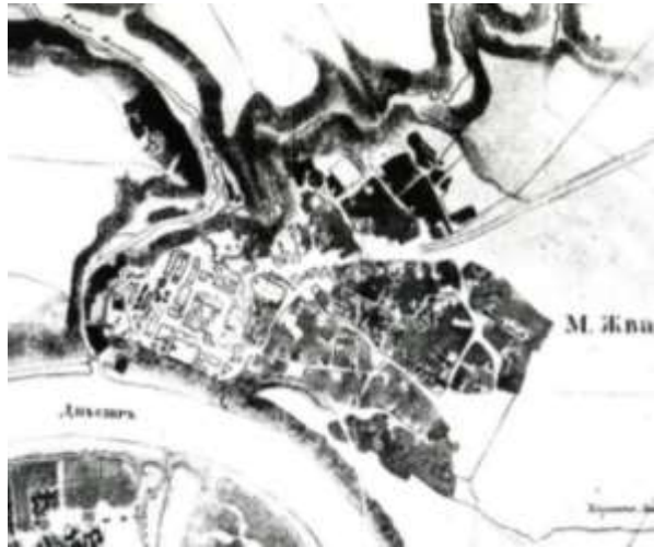
Рис. 4. План Жванця на плані 1840-х років (Фонд НІАЗ «Кам'янець». Інв. № 9784218.