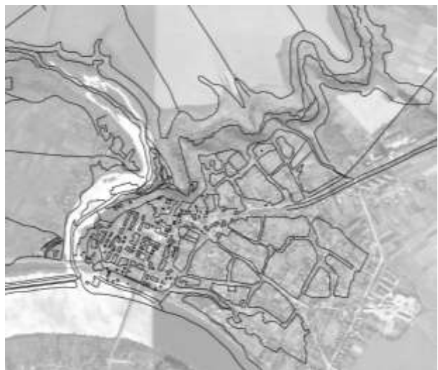
Рис. 6. Звірка плану 1840-х рр. з сучасним космічним ортофотопланом. Прорис. Виконавець І. Литвинчук