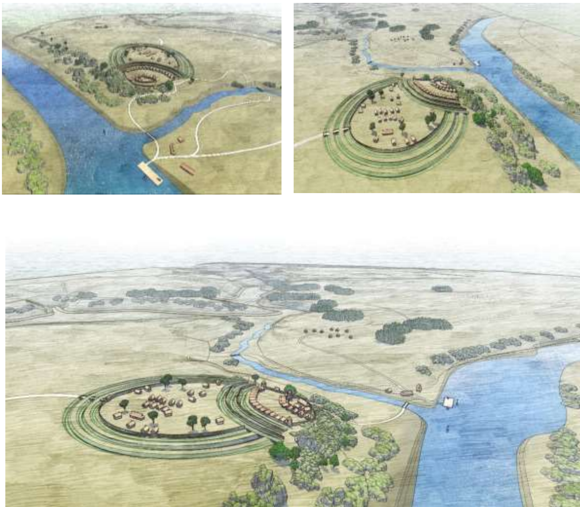
Рис. 7. Реконструкція городища Плав станом на XIII ст. Автори: Р. Нагнибіда та І. Литвинчук

У 1993 р. пам'ятка була обстежена Л. Кучугурою та О. Якубенко. Досліджувана територія розташовувалась на високому мисоподібному підвищенні правого берега р. Жванчик, в урочищі Загора в західній частині села. Дослідники припустили, що враховуючи наявність значної кількості фрагментів кераміки та прикрас давньоруського часу вказують на ймовірне існування городища. Принаймні, Б. Тимошук, виходячи із вищезгаданих знахідок та враховуючи зручну топографію урочища Щовб з виразними оборонними та господарськими перевагами, припускав існування давньоруського феодального вотчинного замку або дворища (Тимошук, 1982, с.100-119). Тому дослідниці припустили, що існування городища-фортеці в давньоруський час має під собою цілком реальне підґрунтя, але для встановлення необхідні додаткові ґрунтовні дослідження (Бузян та Якубенко, 2004, с.127).