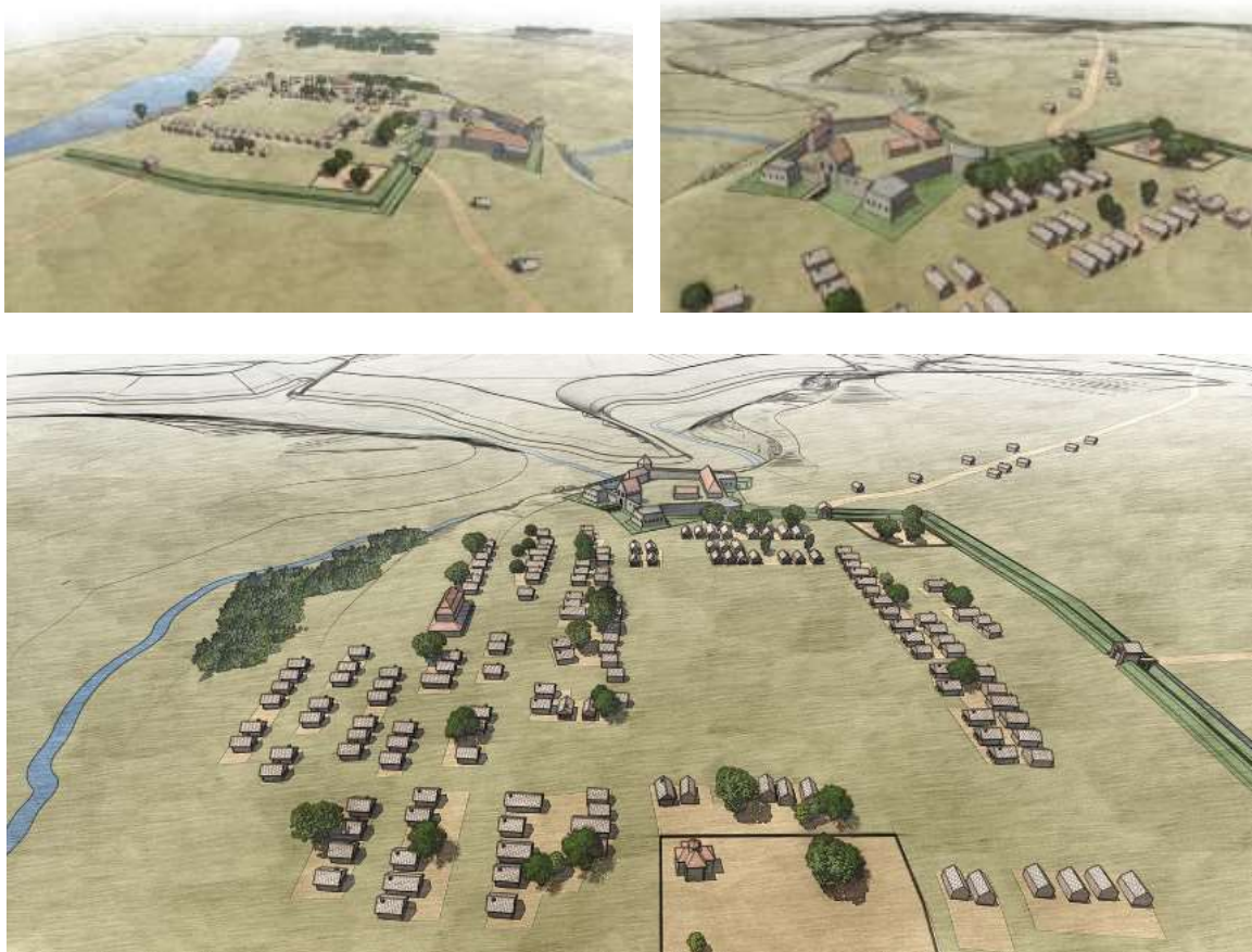
Рис. 9. Реконструкція Жванця станом на XVII-I пол. XVIII ст. Виконав І. Литвинчук.

польський гарнізон, який напав на ворожу армію 22 травня 1769 р. Вже на поч. XIX ст. кордон з Молдовою укріплювала Російська імперія, яка звела вздовж Дністра смугу карантинів, митниць та укріплень, в тому числі здійснено модернізацію оборонних укріплень XVII ст. бастіонного типу - Олександрійських укріплень. У XIX ст. загроза була лише із заходу зі сторони Окопів св. Трійці, які належали Австрії, а місцеве населення прилаштувало територію Олександрійських укріплень під кладовище. Останньою крапкою у військовій історії старого Жванця та його замку була спроба побудувати в місті потужну фортецю царським урядом у 1840-х роках (проти Австрійської імперії), в результаті чого держава викупила місто у приватного власника О. Комара, що змусило багатьох мешканців Жванця переселитись в інші міста. Кошторисний проект так і не був здійснений, а із втратою власника, місцеве населення поступово використовувало камінь із замку для своїх господарських потреб.