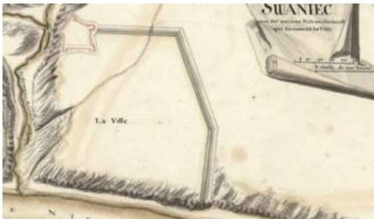
Рис.1. План Жванця Максиміліана Фюрстенхоффа, I третина XVIII ст.

Наступні картографічні джерела XIX-поч. XX ст. (карта Шуберта, карти генштабів) можуть слугувати допоміжними джерелами у вивченні періодизації містобудівних змін Жванця.