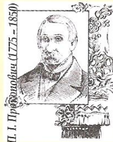
П. І. Прокопенко (1775 - 1850)

Щомісячний науково-виробничий, інформаційний масовий галузевий журнал пасічників України